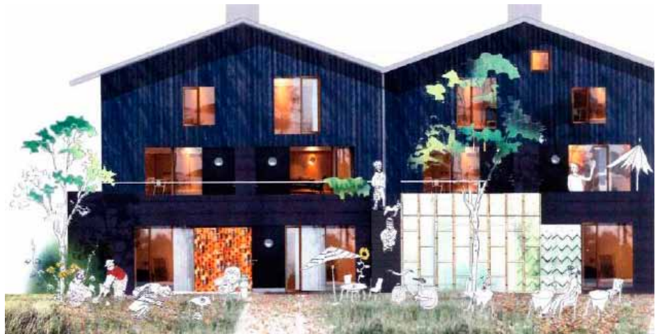
Inspiration, men lidt for højt.