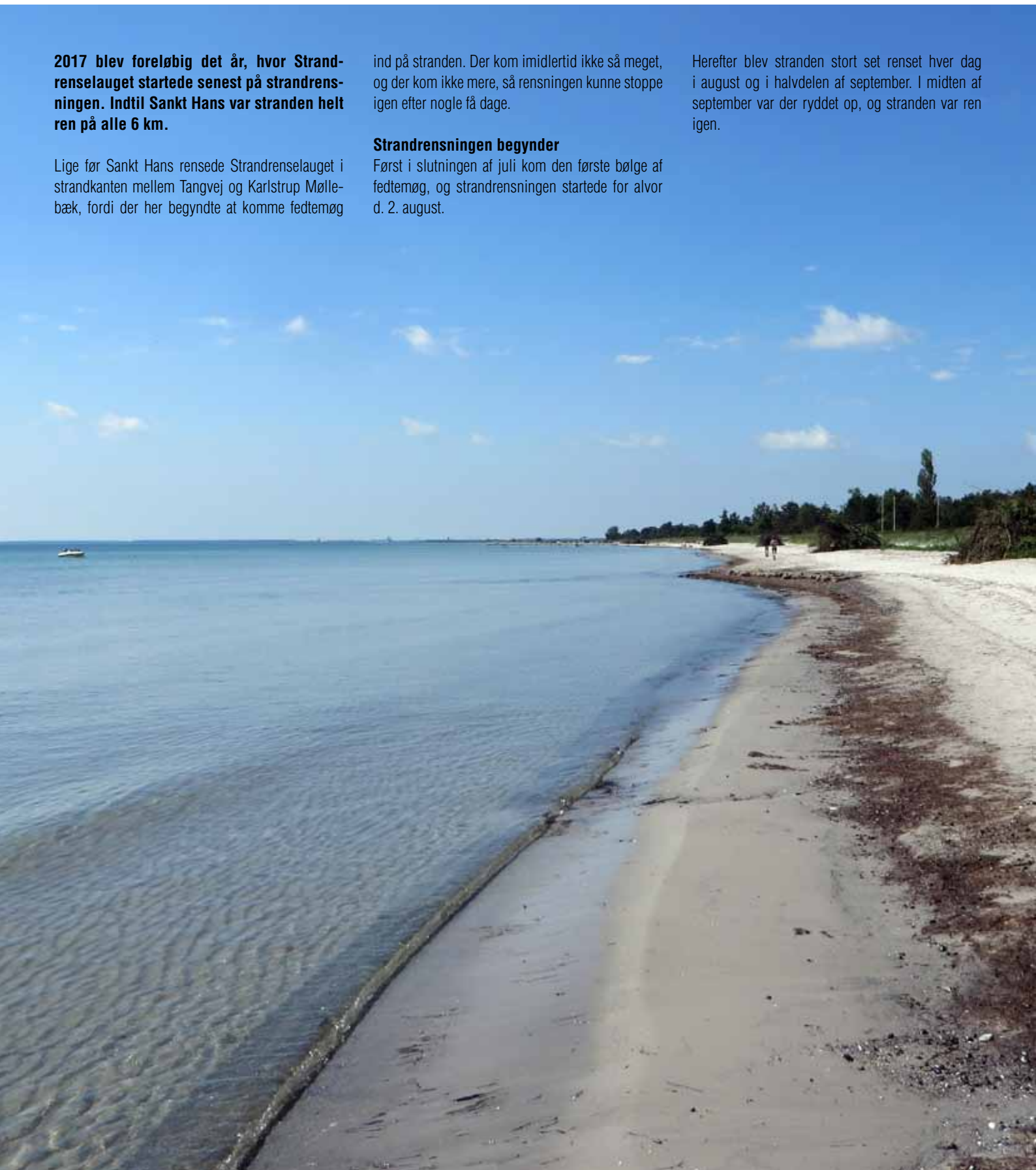
Stranden helt ren d. 19. juni 2017, lige før Sankt Hans..

Herefter blev stranden stort set rensset hver dag i august og i halvdelen af september. I midten af september var der ryddet op, og stranden var ren igen.