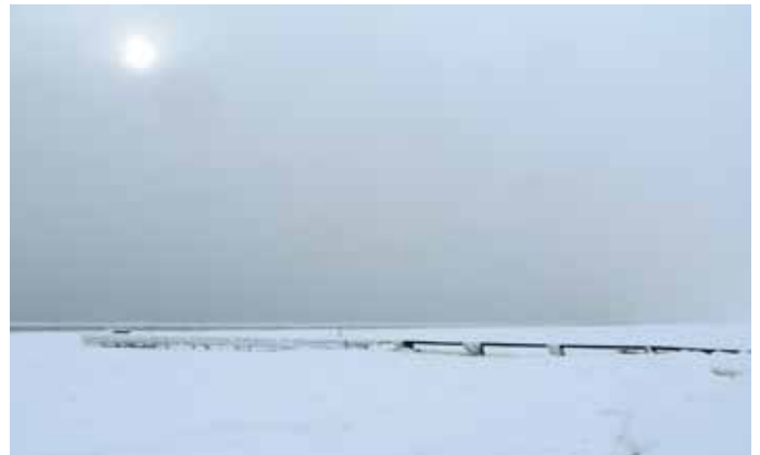
Stranden d. 8. marts 2018, foråret er på vej..