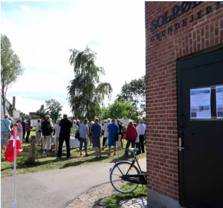
Tak til Tårnets sponsorer.

Solrød Center, stormfloden i januar 2017, risikostyringsplan for oversvømmelser og den lange kamp mod Jernbanen København-Ringsted, som Solrød Kommune og SSG jo som bekendt desværre tabte.