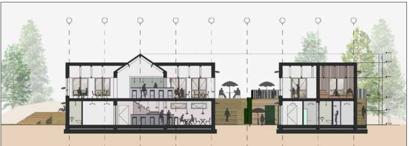
Foreløbigt forslag til snit og indretning af bygninger, som skal huse klubber og restaurant og cafe-aktiviteter.