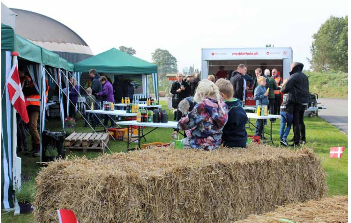
Åbent hus på Solrød Biogas, efterår 2017.

og dels, at biogasproduktionen forbedres, idet tungen kan tilføres i et løbende flow og er friskere, når den tilføres.