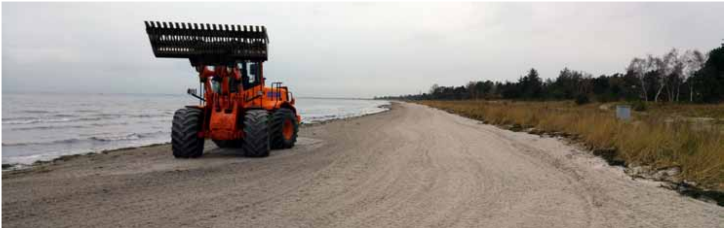
Stranden d. 24. november, Der er rent igen på næsten hele stranden.