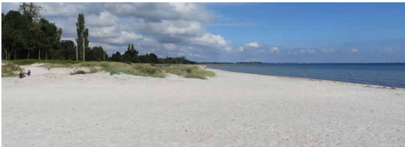
Stranden d. 16. september, Stranden er helt ren igen.

Kørslen til biogasanlægget stoppede i midten af oktober, hvor cadmiumprøverne kom over grænseværdien. Fra midten af oktober kørte vi derfor fedtemøget et stykke ud i vandet, og lagde det i bunker. Denne metode brugte vi første gang i 2016 med gode resultater. Også i 2017 virkede det fint. Bunkerne forsvandt uden at der kom væsentlig mere fedtemøg ind på stranden, og vandet forblev klart.