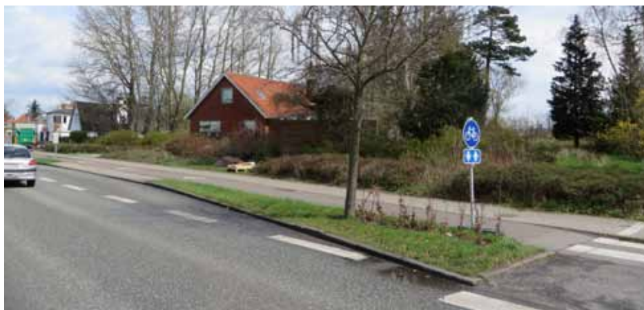
Hvad skal der ske her på Hedevej 2-4.

Arbejdsrunden havde til formål at klargøre Teknisk Forvaltning til at lave en indstilling til byrådet, hvor der skal tages stilling til, om der skal igangsættes arbejde med ny lokalplan. På mødet blev der således ikke truffet konkrete beslutninger, men opnået en fælles tilkendegivelse af, at der kan arbejdes videre.