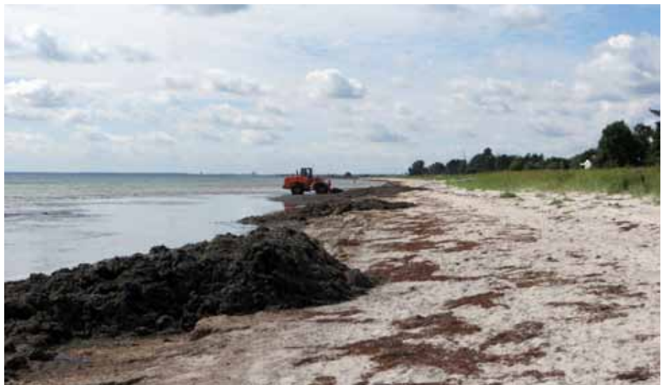
Stranden d. 2. august 2017, rensningen er i gang.