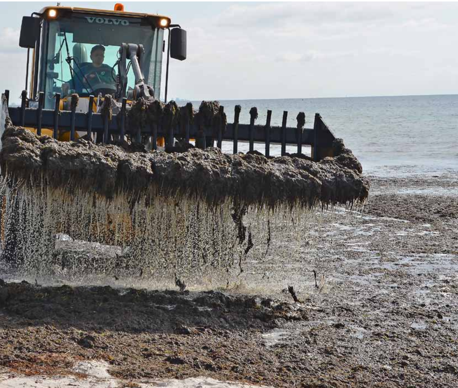
Tang indsamlet i vandet med en risteskovl betyder bedre biogas og færre lugtgener.

Hen over sommeren modtog anlægget årets høst fra strandrensningen i Solrød, som uden problemer og til glæde for strandens gæster kunne tilføres biogasanlægget. Solrød Strandrenselaug har ændret deres rensemetoder, således at tangen nu leveres kontinuerligt til biogasanlægget i stedet for at ligge på stranden og rådne op mellem rensningerne. Det betyder dels, at lugtgener reduceres