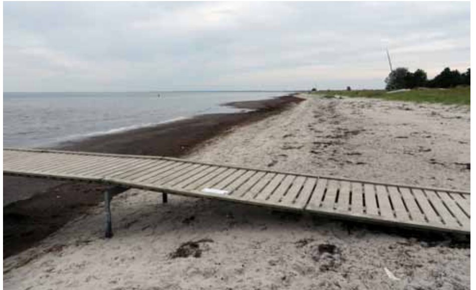
Stranden d. 27. juli 2017, første fedtemøgsbølge.