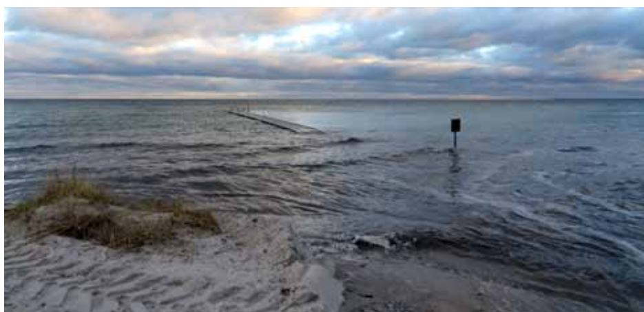
Januar 2017, en 100-årshændelse?

Sikring af kystlinjen fra Trylleskoven til Ventedtsvej sker ved sandfodring. Det gennemsnitlige sikringsniveau i Klitrækken er 2,04 m hvorfor sandfodring kun er aktuel på de lokale lavninger