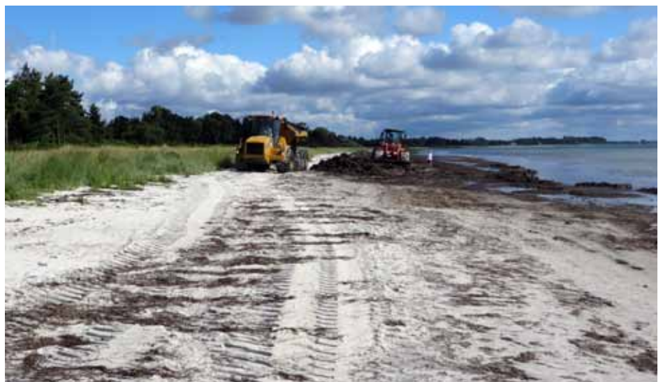
Stranden d. 10. august 2017, fedtemøget køres til biogasanlægget..