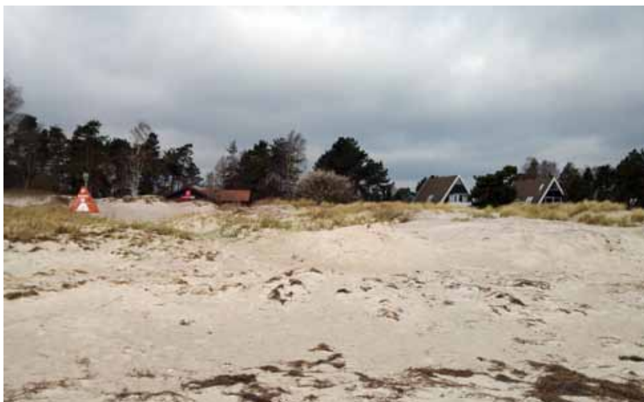
Plads til Strandens Hus.

Og muligheder er der mange af her i Solrød Kommune. Vi er ikke alene begunstiget af en engageret og ressourcestærk befolkningsgruppe, også vores