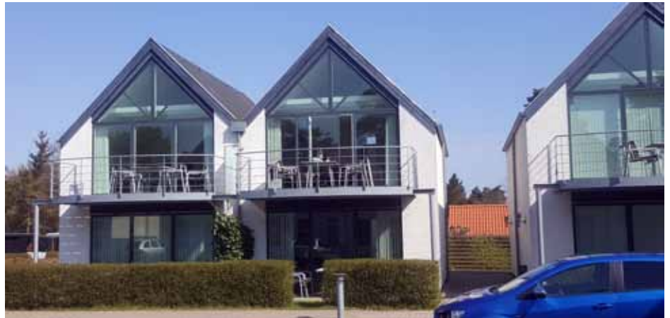
Inspiration fra Marielyst på Falster.

Såfremt byrådet beslutter at igangsætte arbejde med ny lokalplan, er det aftalt, at Teknisk Forvaltning indkalder arbejdsgruppen igen. Herudover vil normal procedure med høring mv. blive igangsat når eller hvis arbejdet når dertil.