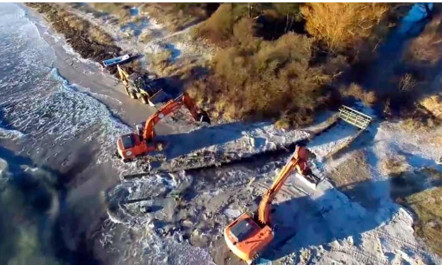
Ved Karlstrup Møllebæk, januar 2017.

Byrådet har på sit møde den 26. februar 2018 tiltrådt den indstilling om kystsikring, som er udarbejdet af kommunens administration efter oplægget fra de 4 grundejerforeninger ved Solrød Strand: Karlstrup Strands Grundejerforening, Solrød Strands Grundejerforening, Jersie Strands Grundejerforening og Søndre Jersie Strands Grundejerforening.