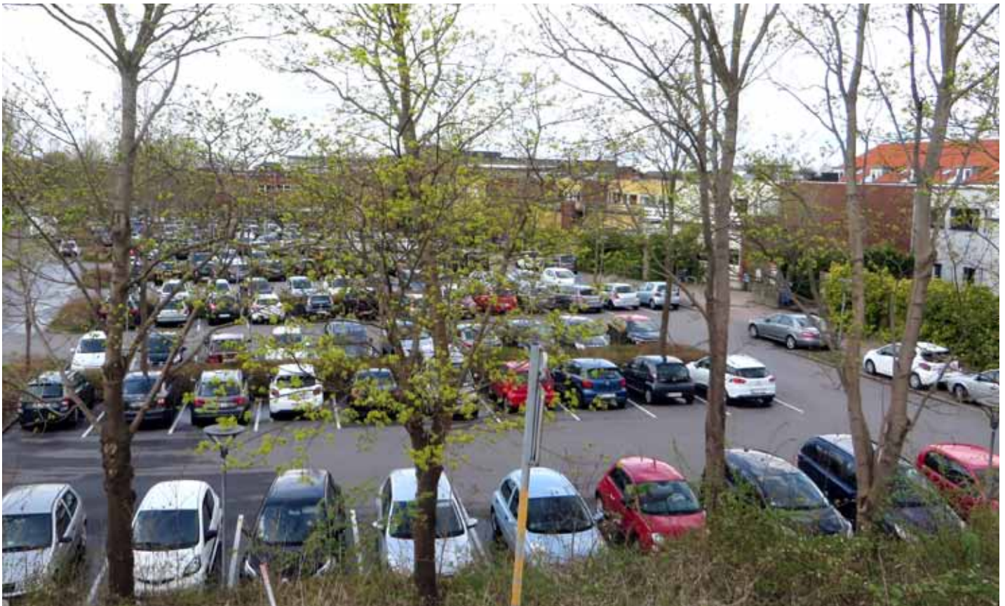
Parkering i Solrød Center.

Med disse ord vil jeg ønske jer alle en rigtig god sommer. ■