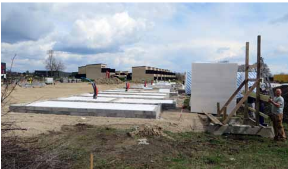
Byggeri og færdige huse ved Trylleskov Allé.

unikke placering er noget helt særligt. Jeg vil i den forbindelse gerne fremhæve vores smukke strand, som et særligt attraktivt område, som mange borgere også er glade for at benytte.