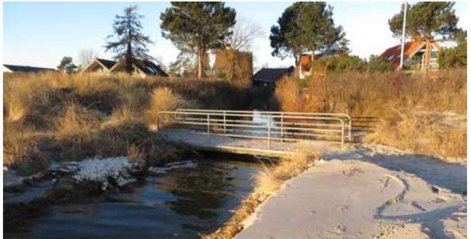
Der etableres højt vandlukke ved åudløbene.

De 4 grundejerforeninger er overvejende indstillet på et solidarisk princip. Udgiftsfordeling kan tage udgangspunkt i matriklernes størrelse og beliggenhed. Andre kriterier kan være ejendommens anvendelse og værdi, afstand til strand og rekreative værdier, naturbeskyttelse, fællesfunktioner mv.