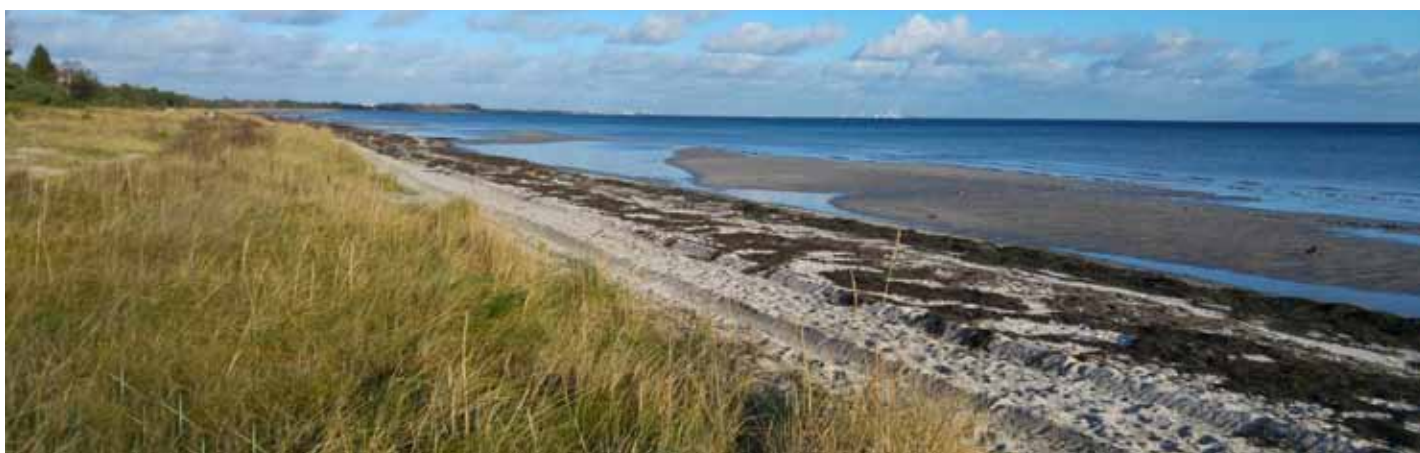
Stranden d. 11. november, rensning nødvendig..