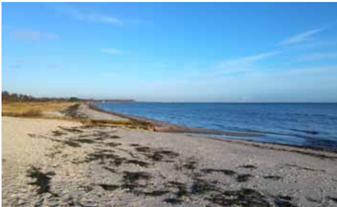
Stranden d. 2. januar 2018, helt ren strand.

Strandsiden 2018 udkommer i juni. Så er det forhåbentlig sommer, og vi nyder vejret og stranden. Det sidste billede er derfor et tilbageblik til stranden den 8. marts, hvor foråret stod lige på spring, men dog først kom for alvor i april. ■