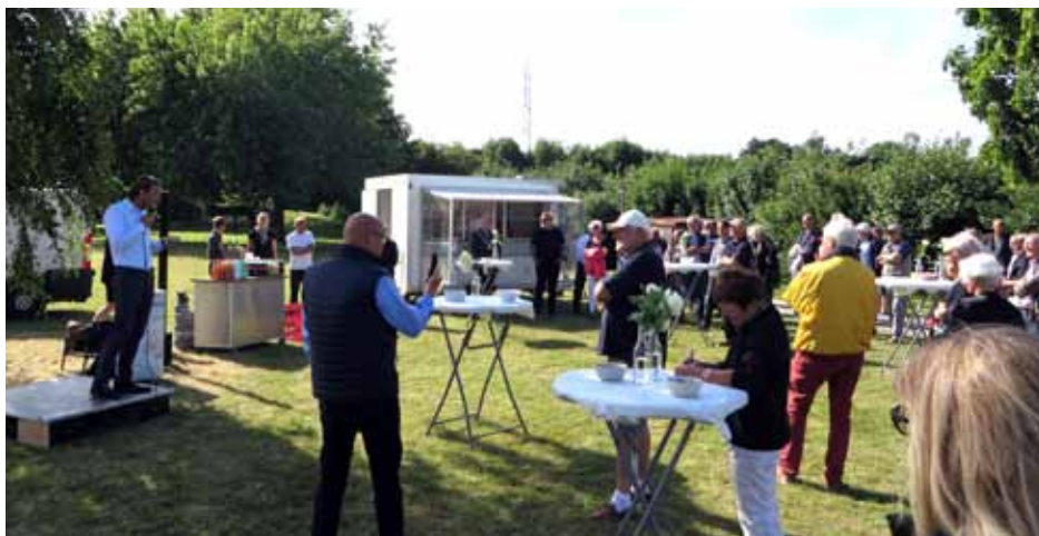
Velkommen – til medlemmer og venner af vores gamle forening.

Nu går Solrød Strands Grundejerforening i gang med de næste 100 år, hvor vi lover at forsøge at påvirke udviklingen af vores kommune på samme måde som vi har gjort de sidste 100 år. Måske også på andre måder.