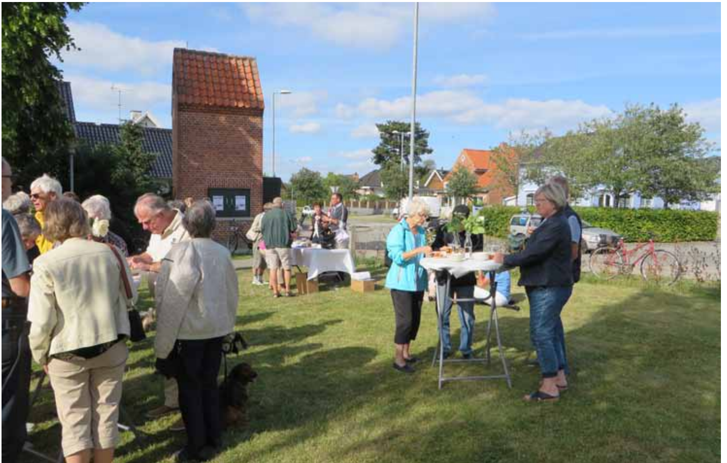
Transformatortårnet er med i billedet.