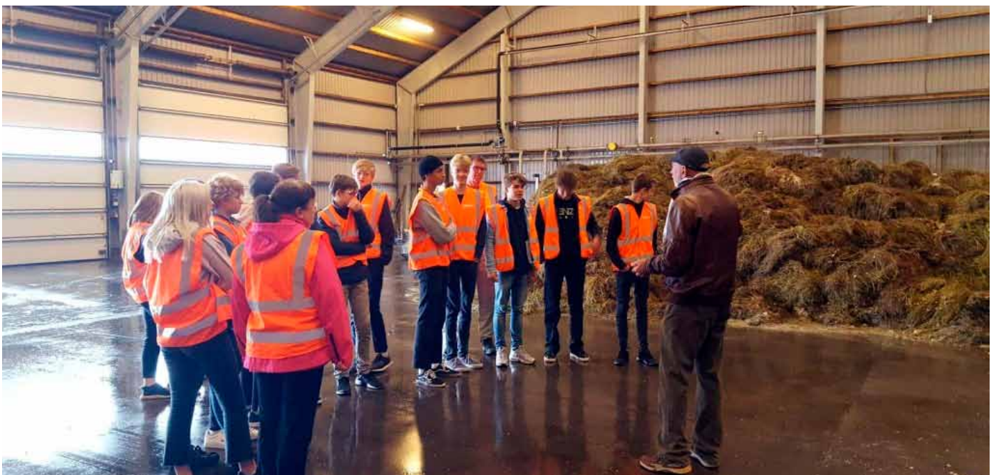
En klasse er på besøg på Solrød Biogas.

processer omkring et biogasanlæg. Til åbent hus arrangementet blev Solrød Biogas' nye uddannelsesmateriale offentliggjort til glæde for lærere og elever fra landets folkeskoler. Materialet opfylder