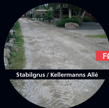
Stabilgrus / Kellermanns Allé

...er det noget du kender til? Hvorfor ikke én gang for alle, få løst de problemer ved at, få en fast vedligeholdelsesfri og økonomisk forsvarlig overfladebelægning. Fås i udvalgte farver.