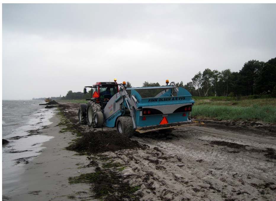
Strandrensemaskinen maj 2013