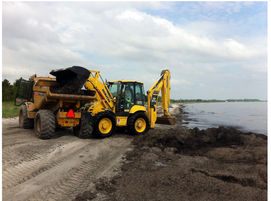
Strandrensning maj 2013