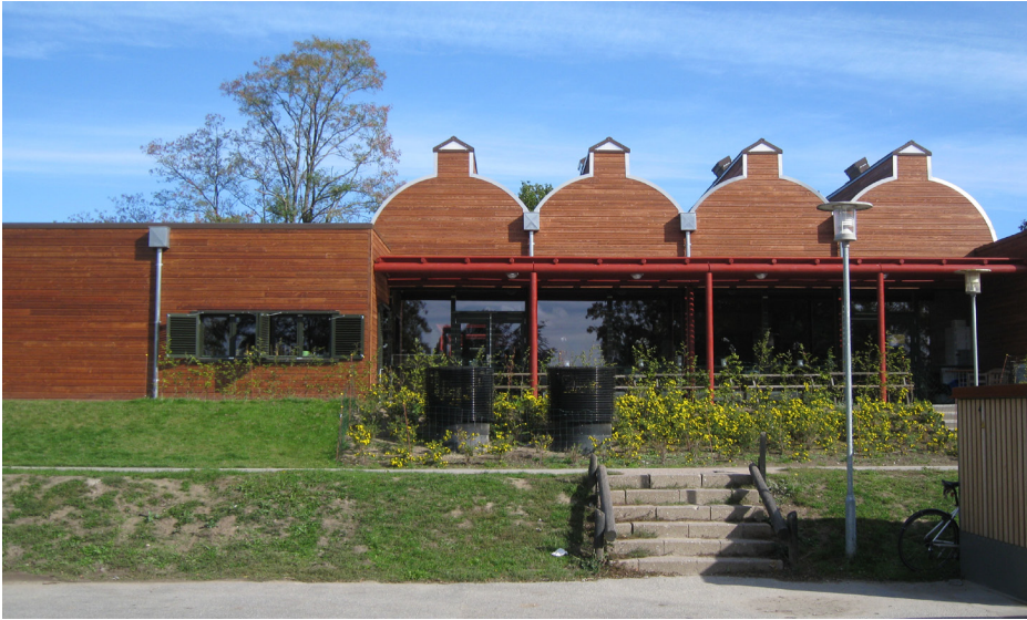
"Folkeskolen er et af de vigtigste kerneområder i kommunen." Billedet: Uglegårdsskolens nye indskolingshus.

tede byrådet, at de penge, som Solrød Kommune har fået i tilskud fra staten, "krone-for-krone" bliver overført til skoleområdet. Vi har samtidig afsat en ekstra pulje til at understøtte inklusionen i folkeskolen, hvor der over de seneste par år er blevet inkluderet et stigende antal børn.