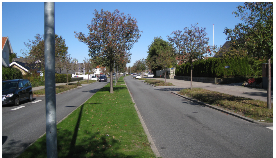
"Udbud af vej og park-opgaver"