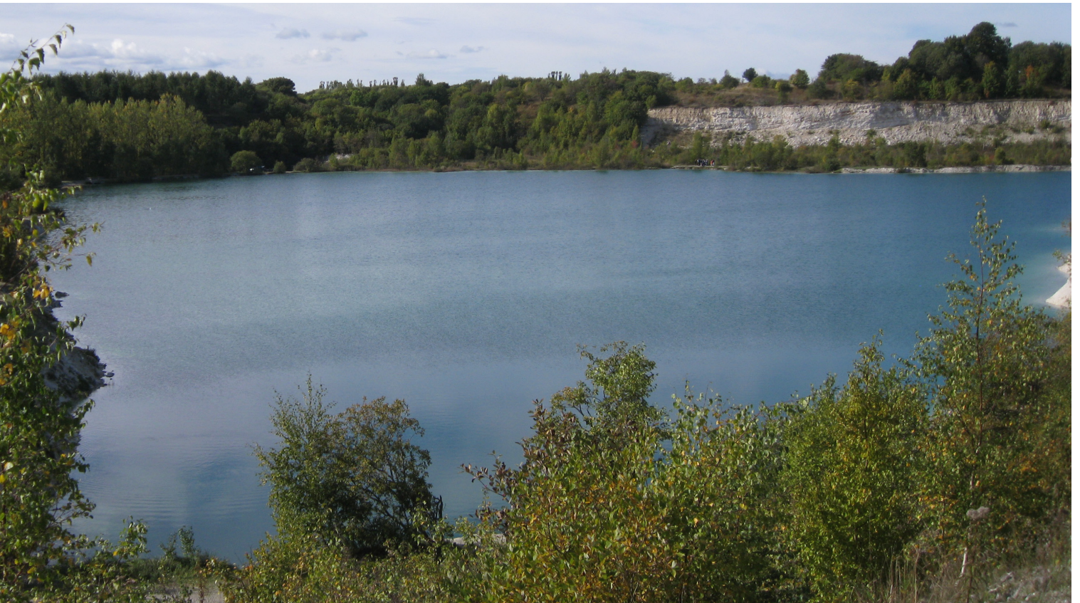
Kalkgraven - En unik naturperle

aktivitet som vejen til at ændre anvendelsen. Kalkgraven er afsides beliggende og øde i aften timerne, hvilket måske tiltrækker eller opfordrer til en uhenigtsmæssig, eller måske ligefrem destruktiv, opførsel.