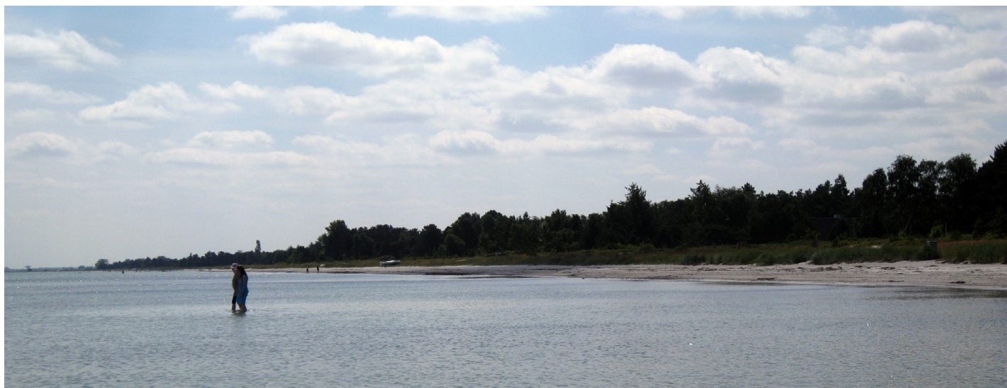
"Den flotteste strand i mands minde."

Jeg plejer at sige, at det letteste i verden er at træffe en beslutning. Det, der er svært er, at implementere den. Det er også derfor byrådet tidligere i år har besluttet, at overskuddet fra de sparede lønmidler i forbindelse med konflikten i foråret, også skal anvendes til implementeringen. Samtidig beslut-