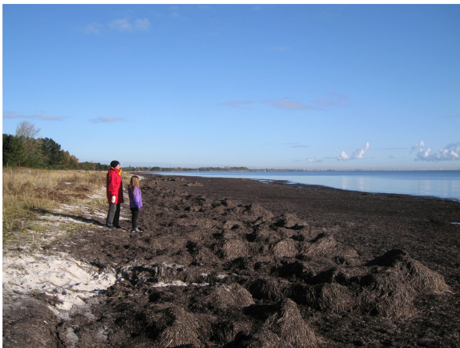
Fedtemøg oktober 2012 ved Grootsvej

Forsøget lykkedes. Dels blev det muligt for entreprenøren at opsamle hovedparten af det gamle