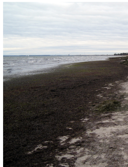
Fedtemøg januar 2013 ved kystvej