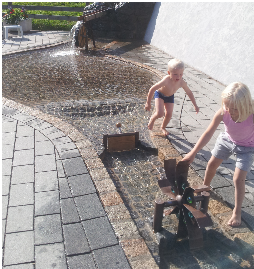
"En lille kilde gennem dele af centeret eller sågar et bassin."

Som beskrevet i tidligere numre af Strandsiden, vil bestyrelsen i Solrød Strands Grundejerforening under overskriften Solrød 2017 forsøge at åbne debat om Solrøds udseende i fremtiden.