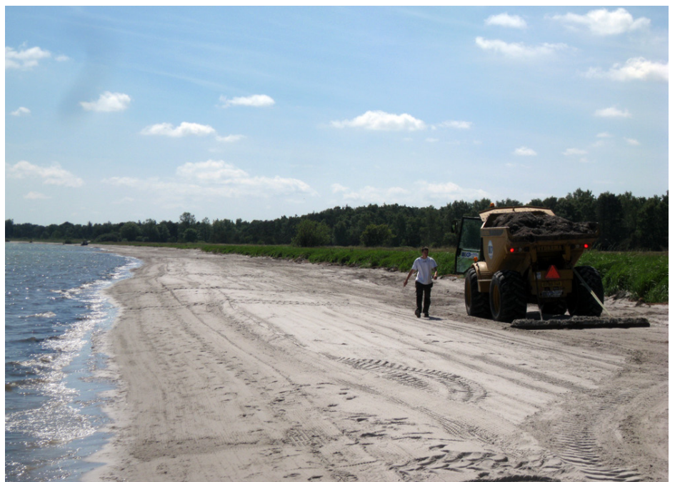
Stranden ved trylleskoven juni 2013