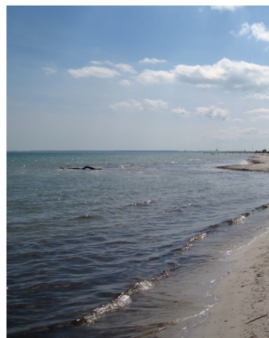
Hedevej mod syd juni 2013