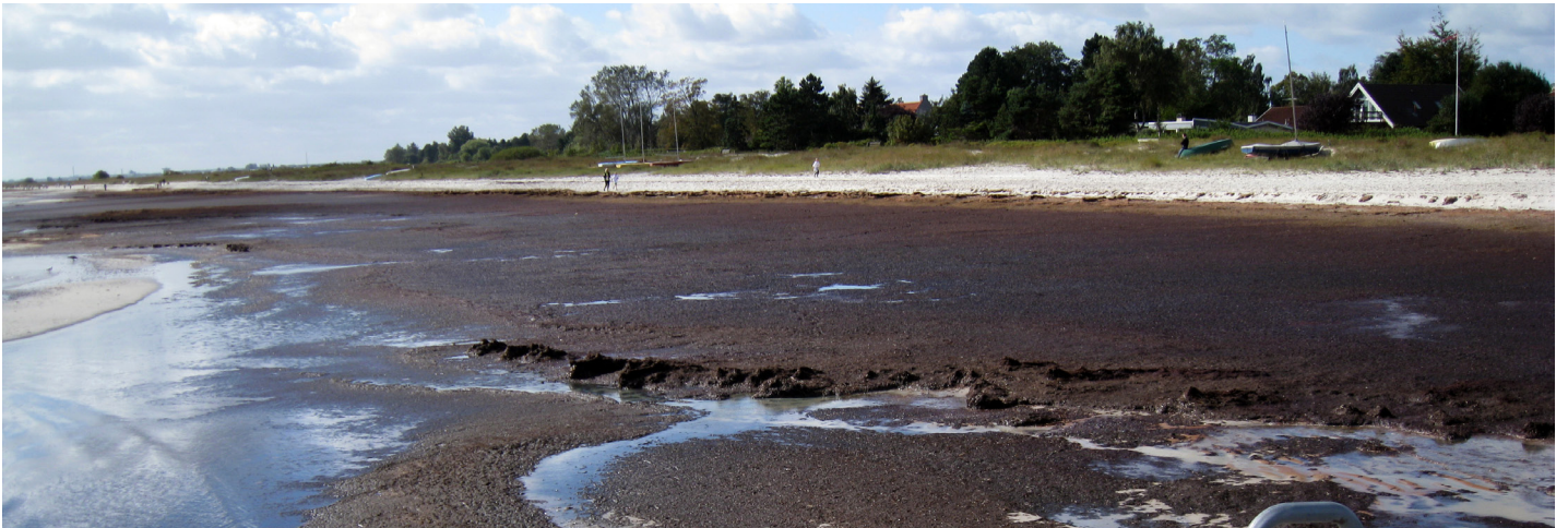
Fedtemøg oktober 2010 ved duevej