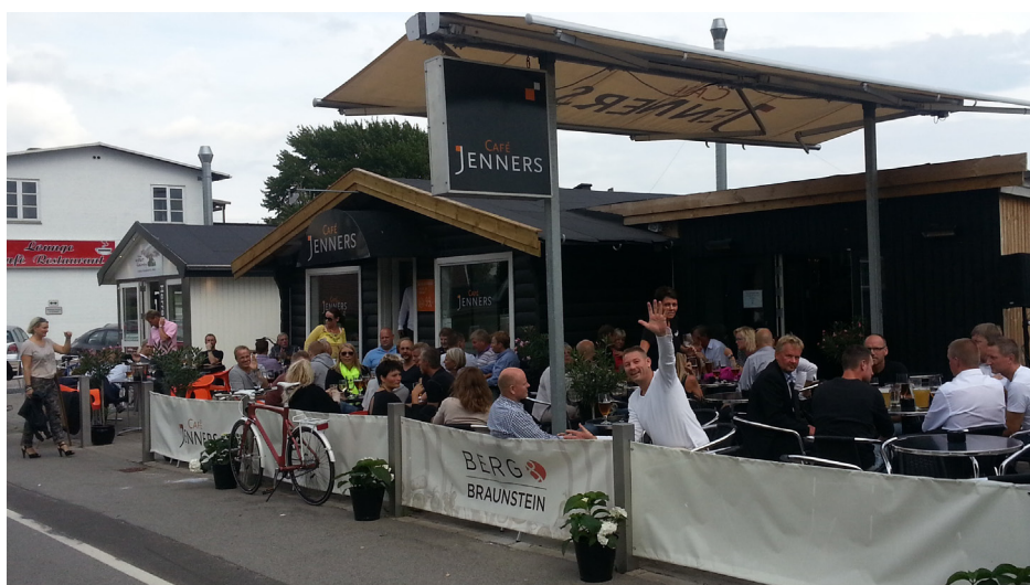
Café Jenners i Karlsrunder

Vi efterlyser derfor debat, som kan føre til en mere hensigtsmæssig anvendelse af området. Vi tror ikke på forbud eller "lukning", men udvikling og