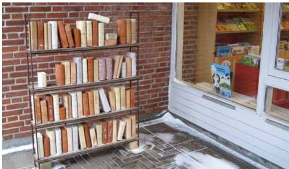
Kunst ved Biblioteket - Lokalhistoriske murstensromaner.

Og inden sommerferien bliver Solrød Bibliotek et såkaldt åbent bibliotek. Det betyder, at borgere kan benytte biblioteket frem til klokken 22 hver aften. I den udvidede åbningstid vil der ikke være personale tilstede, men indretningen bliver ændret, så man også i de timer kan låne og aflevere bøger, læse aviser og tidsskrifter og bruge computerne, og læsegrupper vil kunne bruge lokalerne som samlingssted.