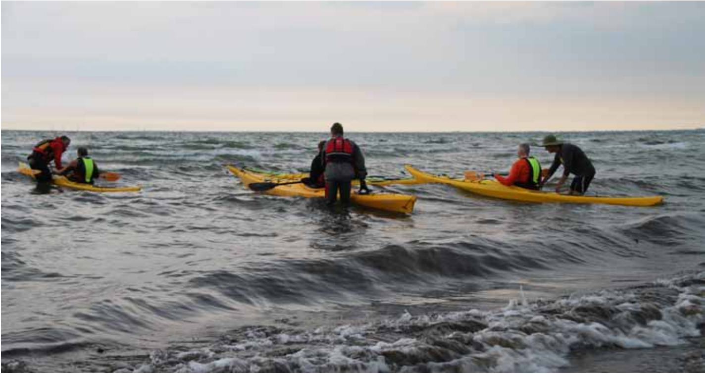
Team Solrød i kajak. Der er skum på bølgende og det er spændende. Instruktørerne sørger for at der ikke sker større uheld i bølgerne

I kajakklubben får du oplevelser i naturen, motion, kondition og et godt sammenhold. Også fordybelse, udholdenhed, råstyrke og udfordring. Og selvfølgelig tryghed og sikkerhed.