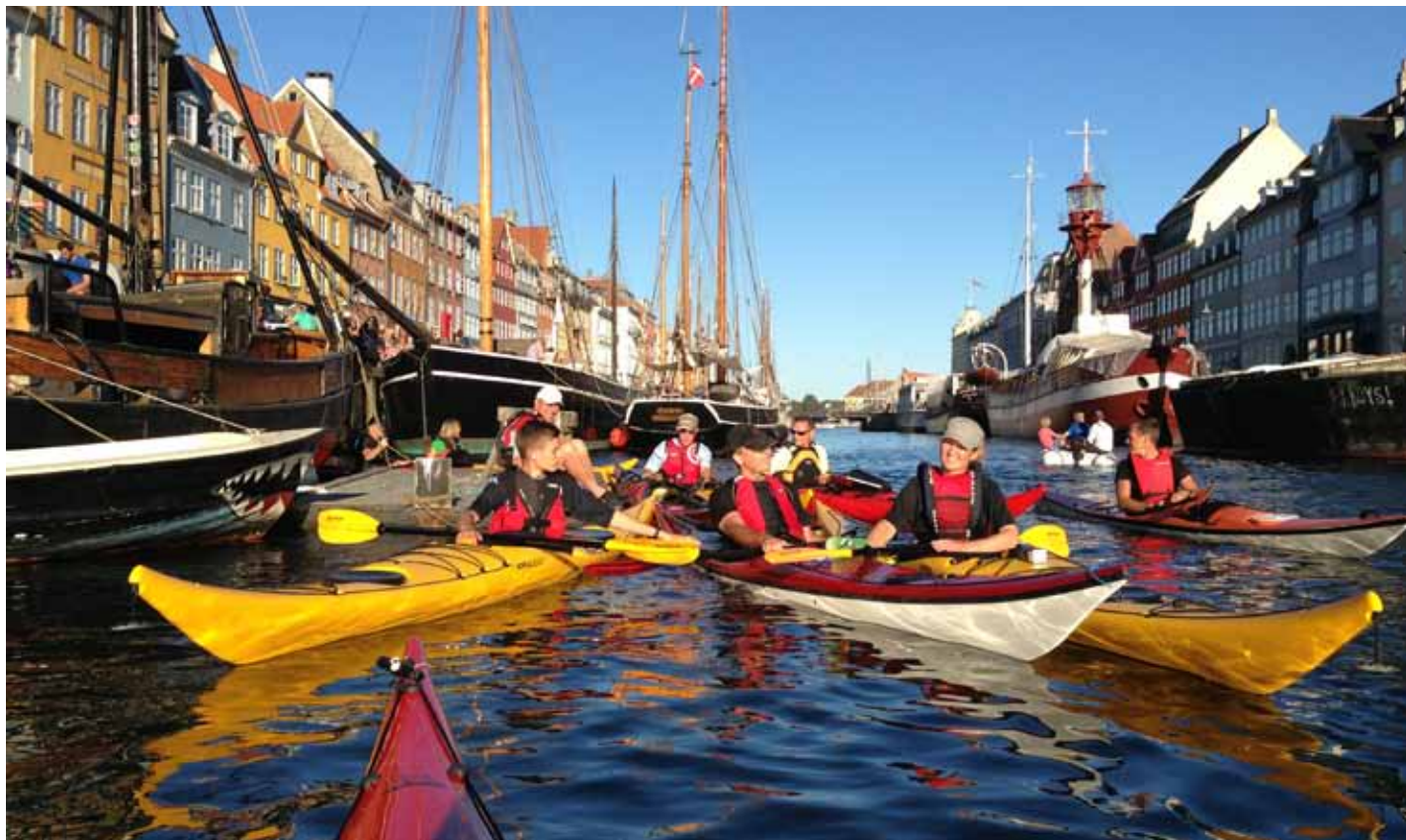
Andre oplevelser får vi, når vi pakker traileren med kajakker for at tage på udflugt til fremmede farvande.

STRANDSIDEN efterlyser ideer og det er kajakklubbens overbevisning, at jo bedre rammer der er for vandsporten, jo mere liv får vi på vandet og omkring området ved Østre Strandvej. Vandsport er dykning, jollesejlere, beach volley, Kite surfing, windsurfing, surfkajak, Vinterbadere, Stand up paddling (SUP), havkajak, kajakpolo og turkajak. Alt det på vandet, der ikke støjer i naturen. Et fælles klubhus på Østre Strandvej vil gøre det meget lettere for ildsjælene at gøre noget for deres sportsgrene.