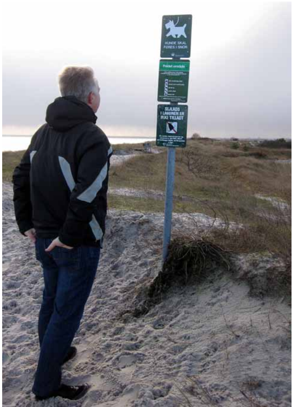
Fredningsskilt ved Stauings Ø

Se nærmere på Solrød kommunes hjemmeside: www.solrod.dk - se under menupunktet "Vand og natur" eller i Naturbeskyttelsesloven, som kan findes på: www.naturstyrelsen.dk ■