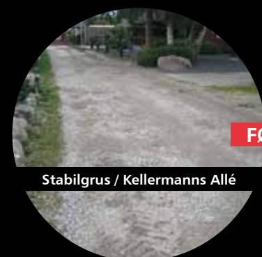
Stabilgrus / Kellermanns Allé

...er det noget du kender til? Hvorfor ikke én gang for alle, få løst de problemer ved at, få en fast vedligeholdelsesfri og økonomisk forsvarlig overfladebelægning. Fås i udvalgte farver.