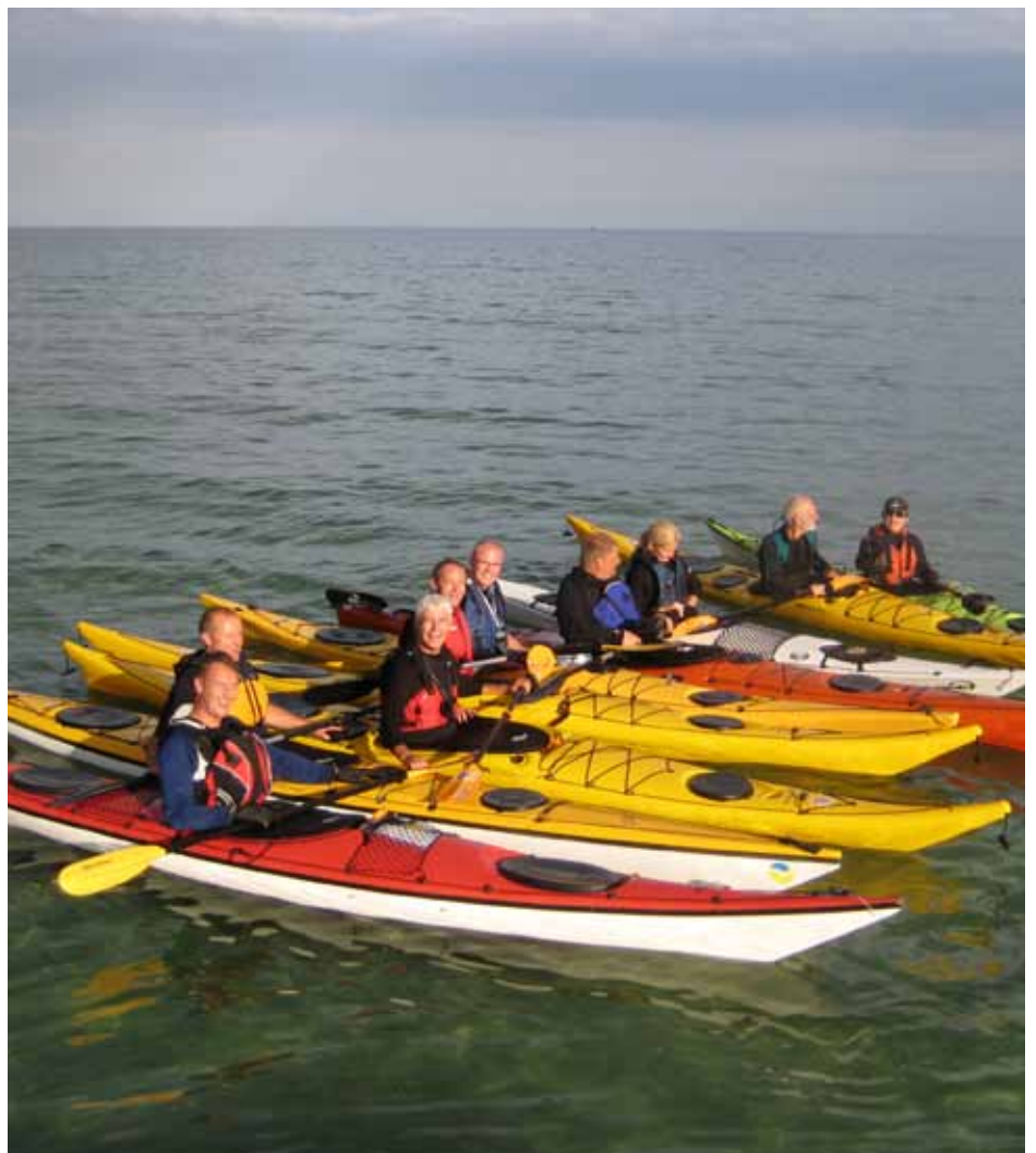
Et af vore mange begynderhold på skolebænken. De lærer alt om sikkerhed og skadefri roteknik og at holde balancen. I klubben uddanner vi 40-50 roere om året.

I år tager vi blandt andet Bornholm Rundt sammen med 100 andre kajakroere fra hele landet. En spændende og flot tur, som vi glæder os meget til.