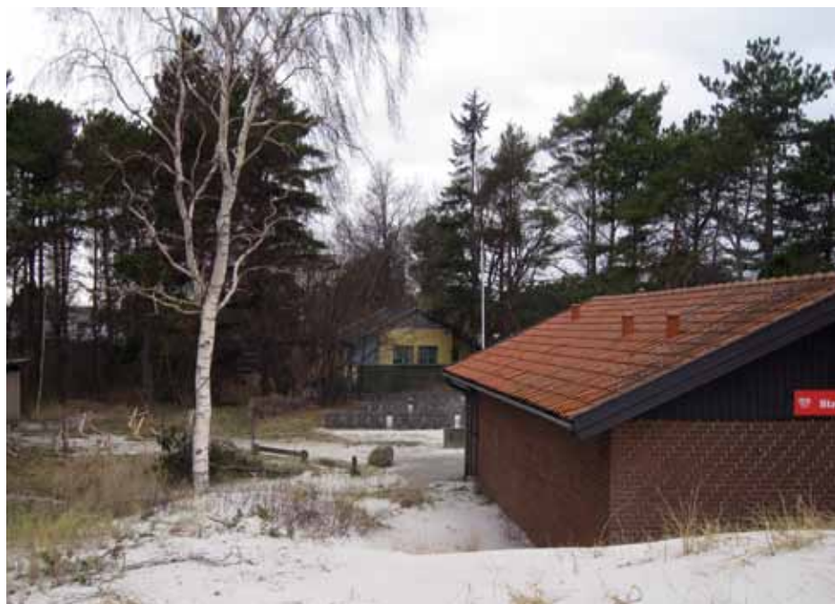
Kajakklubben har et ønske om et nyt klubhus

Miljøet får glæde af det kommende biogasanlæg i Lille Skensved. Planen er, at anlægget etableres som et selvstændigt selskab, med en ejerkreds bestående af de væsentligste aktører.