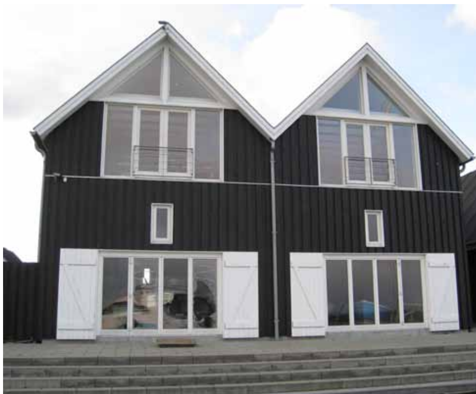
Et eksempel på hvordan klubhuset kunne se ud. I stuen skal der være omklædning, bad og fællesrum og 1. sal indrettes til fysisk træning og klubkontor.

Der mangler et moderne klubhus til alle klubber, der dyrker sport på, under, ved og i vandet. Vi har en meget positiv dialog med kommunen om et placere et fælles klubhus på Østre Strandvej, som indeholder omklædningsfaciliteter, bad, opholdsrum og rum til fysisk træning. Og det skal være et klubhus, der falder naturligt ind i området.