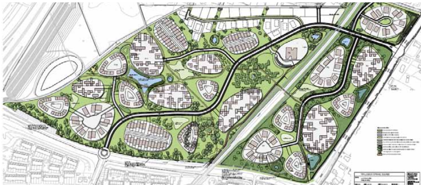
Trylleskov Strand landskabsplan

Biogassen vil blive anvendt på et kraftvarmeanlæg, der producerer grøn el og varme, hvilket bl.a. vil medføre en reduktion af drivhusgasudledningen i Solrød Kommune med mere end 40.000 tons om året. Det svarer til ca. 30 % af kommunens samlede årlige udledning eller 60 % af kommunens reduktionsmål frem imod 2025. Projektet er således både økonomisk og miljømæssigt fordelagtigt for kommunen, for de involverede parter, og for forbrugerne.