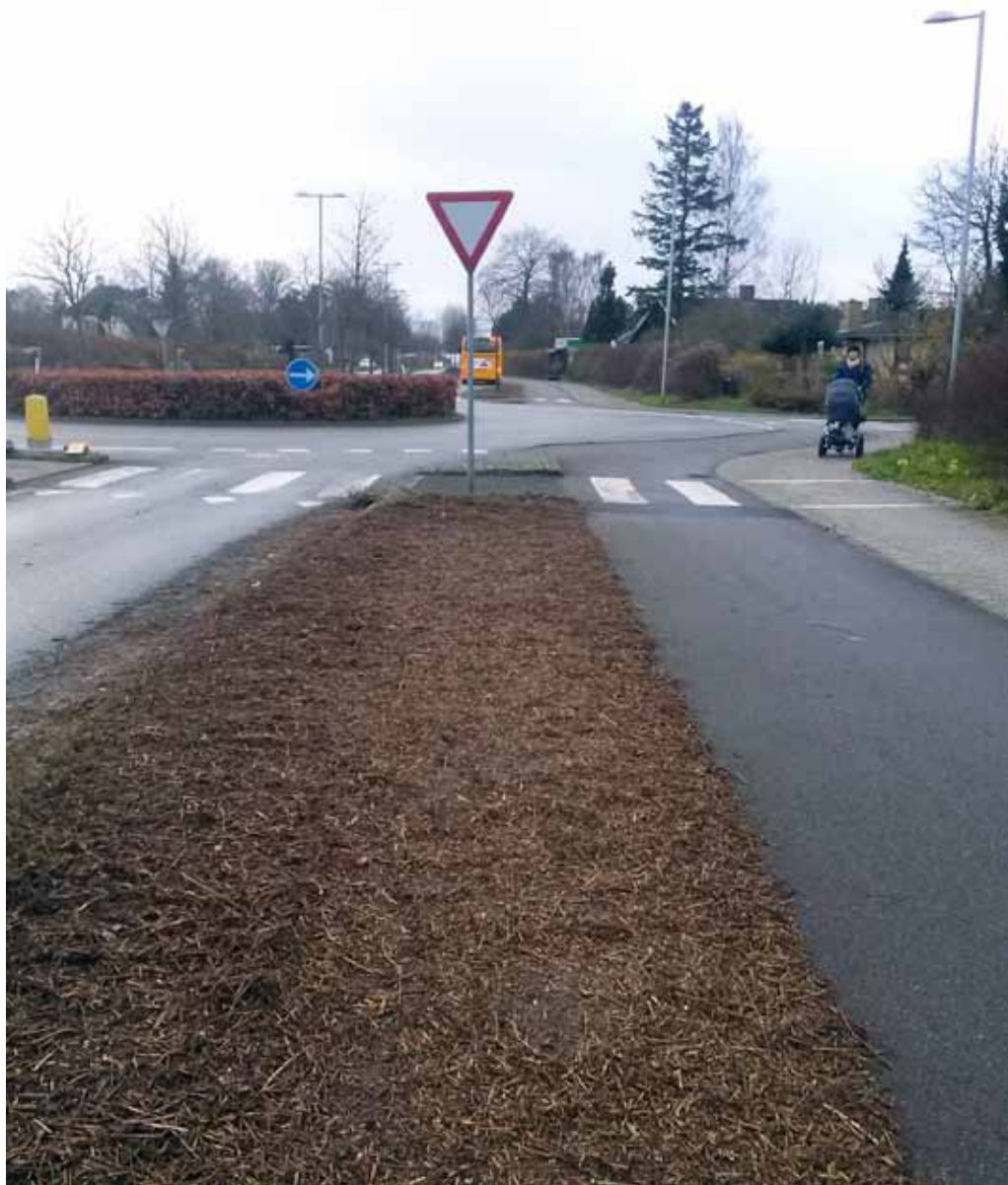
I bedene mellem cykelstien og vejbanen på Solrød- og Jersie Strandvej, vil der fremover være en kombination af græs og bøgehække

Det er et meget brugervenligt ansøgningsmodul, hvor ansøgeren bliver guidet gennem hele processen, og det er både nemt og tidsbesparende for både ansøgeren og kommunen. Jeg håber, der