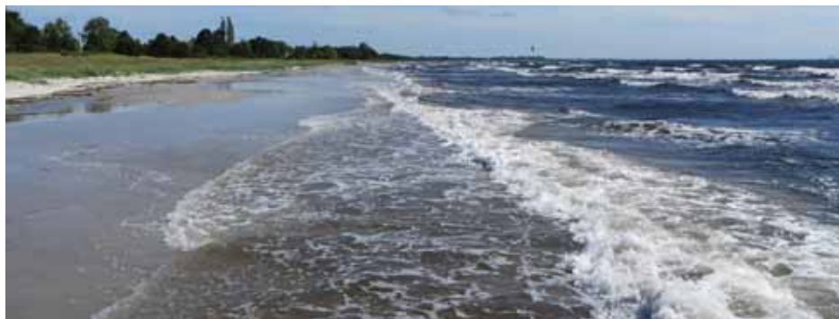
På dag 2 blev stranden overskyldt af kulingen

Det ustadige vejr fortsatte ind i september, hvor vi ikke må rense. I løbet af september og oktober er der drevet temmelig meget fedtemøg ind på stran-