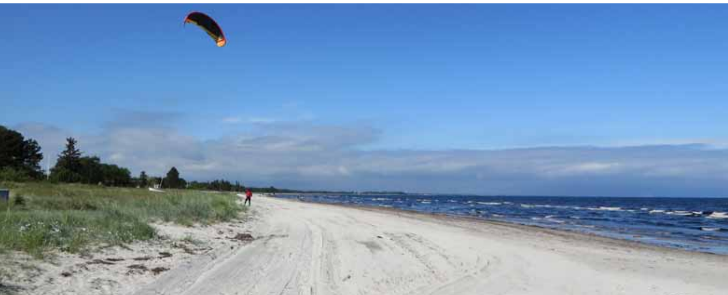
Vi arbejder på ren strand også i 2015.