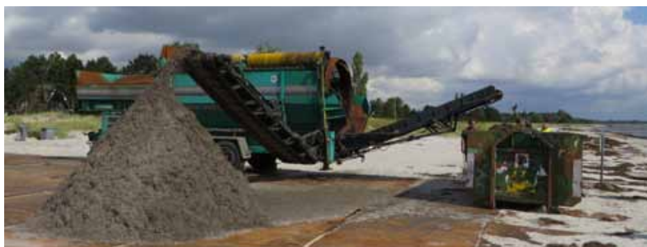
Et af forsøgene indbefattede en meget stor sigte