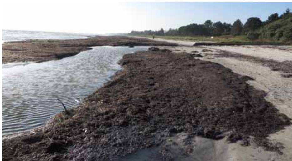
Ved Møllebækkens udløb har bækken ligefrem dannet et nyt udløb gennem fedtemøget.

den. En del af det er ude igen, men navnlig den nordlige del af stranden er hårdt ramt. Ved Møllebækkens udløb har bækken ligefrem dannet et nyt udløb gennem fedtemøget.