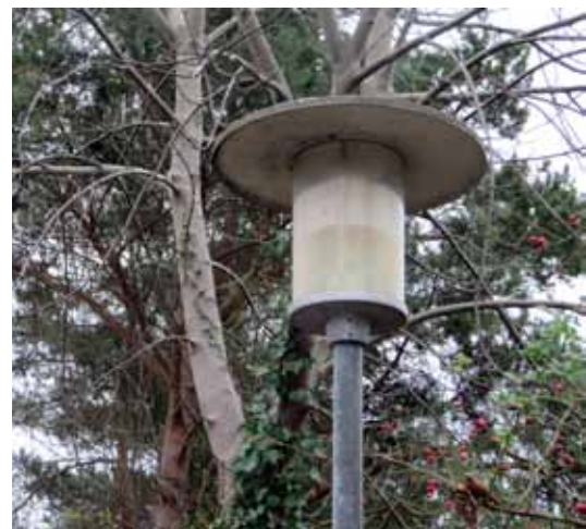
Lampe på Duevej.

I løbet af mødet fremkom to væsentlige konklusioner. Den første vedrører lyskilder, idet kommunen bygger en del af argumentationen på at det efter marts 2015 ikke vil være muligt at købe kvik-sølv-pærer, mens det fra 2016 ikke vil være muligt at købe natriumbaserede pærer. Der blev rejst forslag om i stedet at anvende andre lyskilder (f.eks. LED pærer), hvilket vil kunne levetidsforlænge lamper på de berørte veje. Kommunen har hidtil efter konsultation af SEAS-NVE valgt ikke at anvende LED, men gav tilsagn om at ville genoverveje argumenterne for denne beslutning.