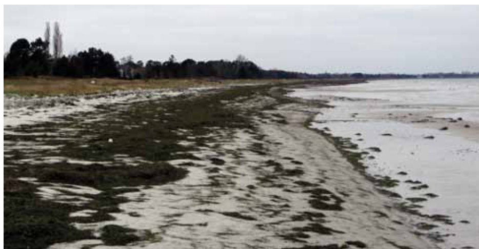
Stranden december 2014.

Netop fordi biogasanlægget kan aftage fedtemøget direkte, håber vi på, at vi kan komme til at rense på en bedre måde end med de tre faste rensninger vi har tilladelse til nu.