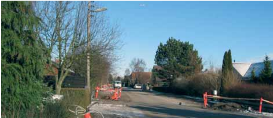
Der er fuld gang i blå zone. Billedet er fra Holmehusvej