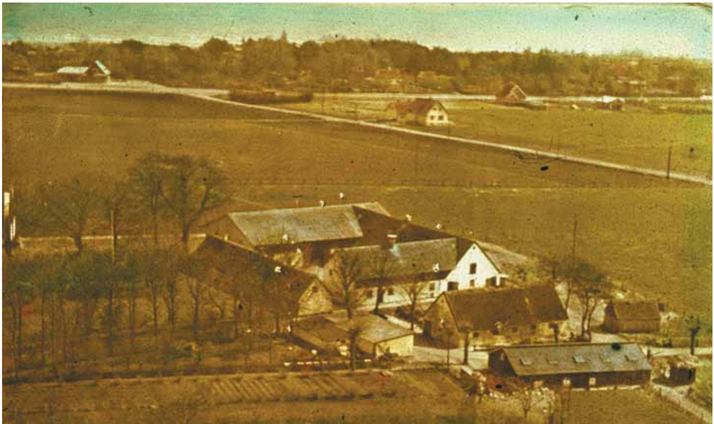
Jernvejsgården. Luftfoto mod øst med Køge Bugt i baggrunden.