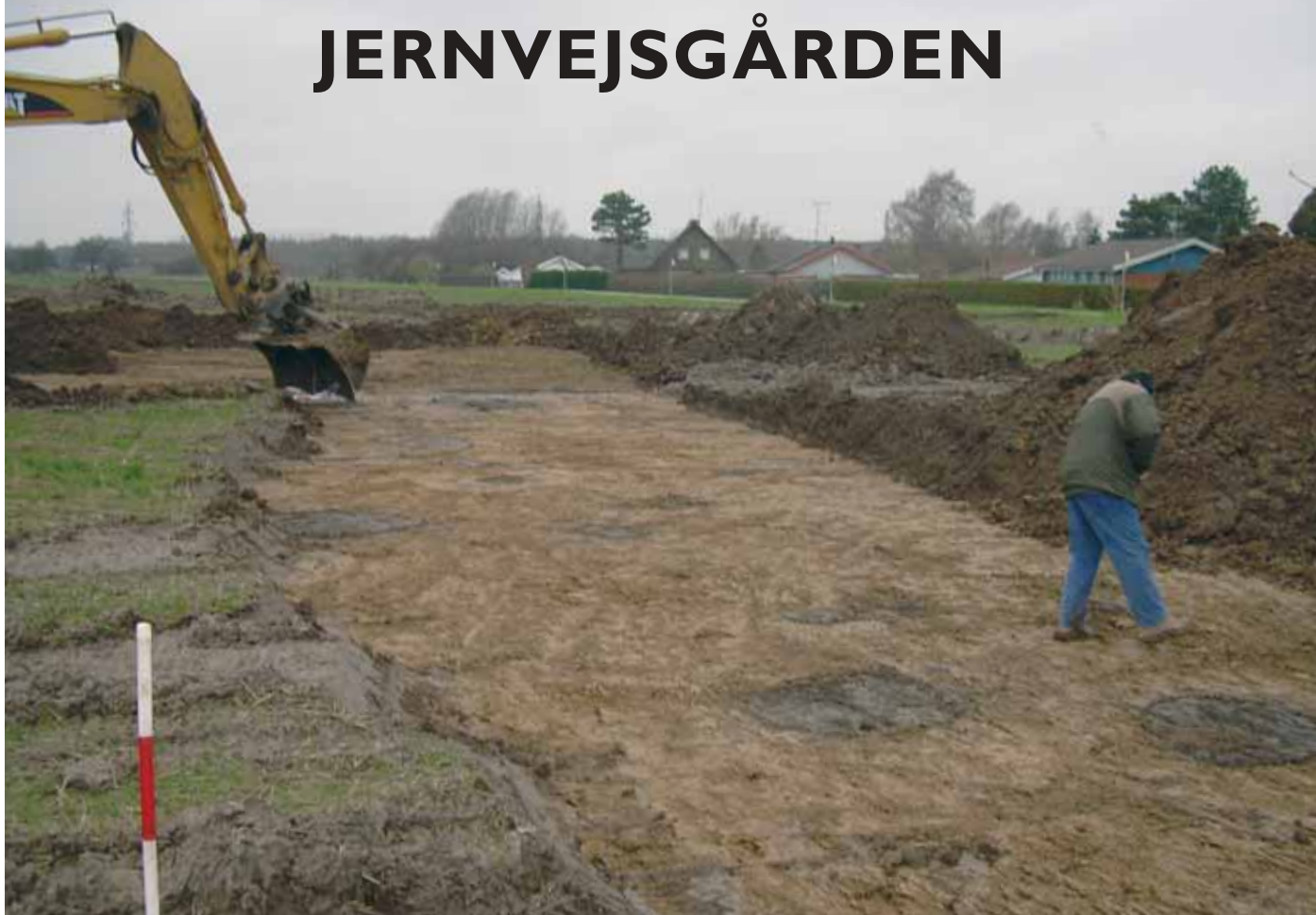
Jernvejsgården december 2006. Køge Museum arbejder.