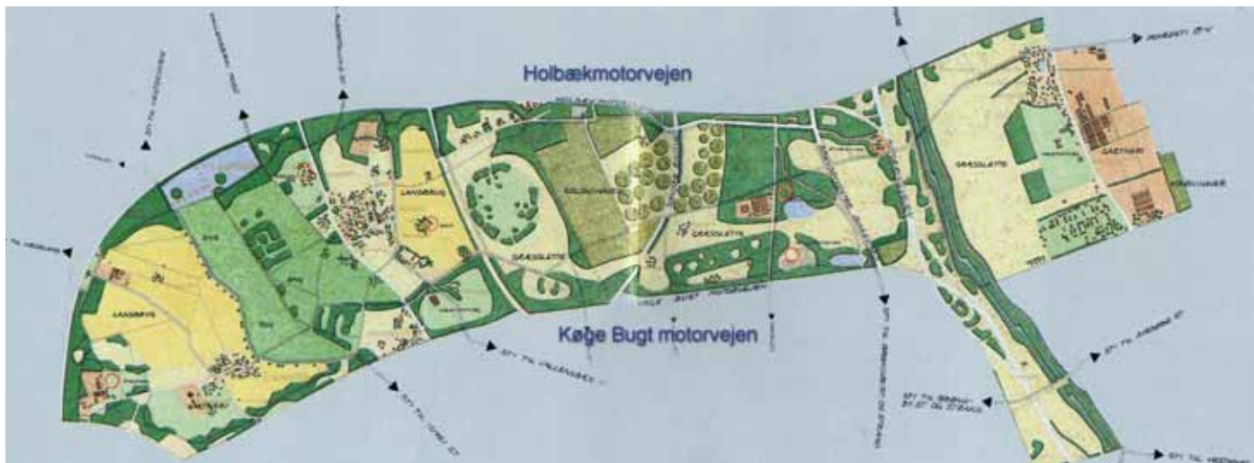
Arealet mellem Holbæk- og Køge Bugt motorvejen.

For næsten et år siden skrev Solrød Strands Grundejerforening til Danmarks Naturfredningsforening for at høre foreningens mening om forslaget til en helt ny jernbane langs Køge Bugt. Vi har kun fået svar fra lokalafdelingen i Solrød, der beklagede, at der ikke var mulighed for en fælles udtalelse. Herudover har vi aldrig fået svar, hverken fra Danmarks Naturfredningsforenings nye direktør eller fra nogle af Danmarks Naturfredningsforenings øvrige lokalafdelinger.