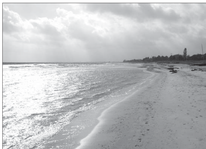
Strandområdet er et rekreativt aktiv, som vi skal passe på til glæde for alle.

er en styrke at vi er en stor grundejerforening der kan tale på næsten en fjerdedel af kommunens borgeres vegne. Vi glemmer i den forbindelse ikke det glimrende samarbejde vi har med tilsvarende foreninger mod syd og nord.