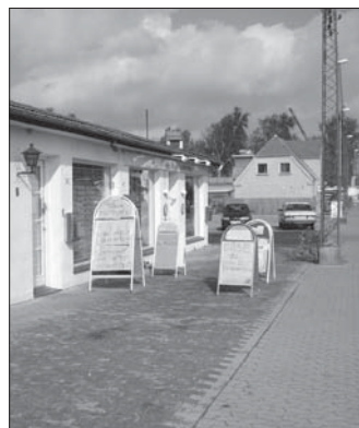
Vi skal også værne om miljøet på Strandvejen.

Vi vil opretholde og udbygge dialogen med byråd og administration og vi vil til stadighed søge at være positive og konstruktive i vores argumentation og eventuelle kritik.