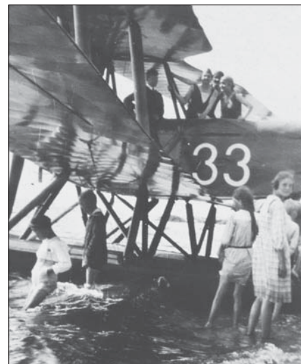
Hvad er bedre til at score badenymfer end en vandflyver?

Avedøre flyveplads blev benyttet af Marinens fly og enkelte civile fly. Den spæde civile lufttrafik flyttede til Kastrup i 1925. Flyet har muligvis haft sin base i Avedøre.