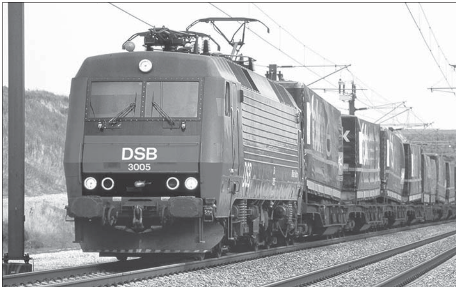
Lad os stå sammen mod nye jernbanespor i vores baghave.

Samtidig skal S-togssporet opgraderes, så man kan pendle fra Køge og Solrød på 20-25 minutter, så den kollektive trafik for alvor bliver attraktiv. Dette er løsninger, der ikke giver mere støj, mere forurening og flere spildte timer i køer og forsinkelser, som indtænker hele samfundets udvikling i planlægningen af fremtidens infrastruktur. Heroverfor står hovsa-politikken, hvor man starter med at sige, hvilken investering man gerne vil have, og derefter finder begrundelsen for den.