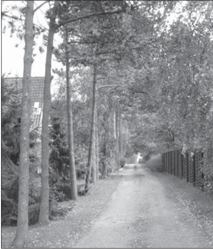
Vi skal værne om vejmiljøet.

For at give mulighed for at styrke den gensidige meningsudveksling har grundejerforeningens bestyrelse besluttet med mellemrum at afholde debatmøder med vejlaugene eller grupper af vejlaug, afhængigt af emnernes geografiske betydning.