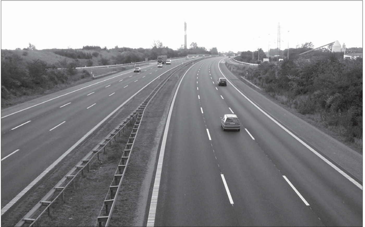
Støjudvalgets stædige kamp blev belønnet. Der er lagt ny støjdæmpende asfalt på motorvejen ud for Solrød Strand.

Trafikken vil stige, det ved vi, både for passagerer og for gods. En stor del af denne stigning skal vi have lagt i den kollektive trafik, fordi der ikke er plads til flere biler i byerne og på vejene. Faktisk er trængselsproblemerne på de europæiske veje i dag er så store, at EU regner med, at omkostningerne om fem år når 80 milliarder Euro. Herhjemme vil alle i Solrød kende til køproblemerne på motorvejene.