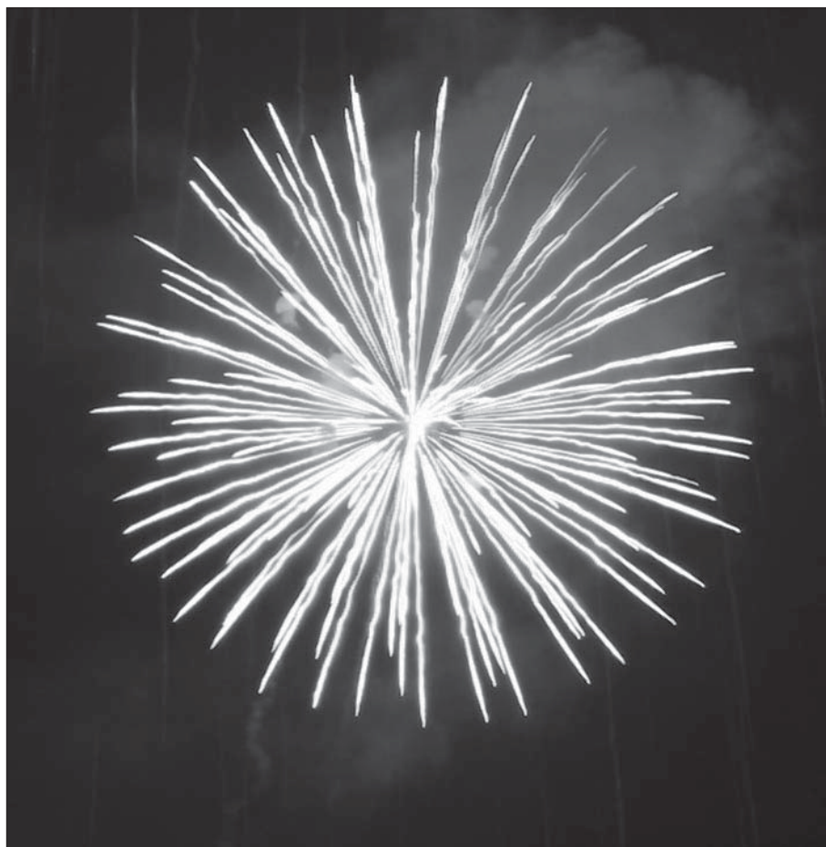
Fyrværkeriafbrænding i utide er en omsiggribende uskik, der skaber mange klager.

Er årsagen, at vi ser vi for meget fjernsyn med bulder og brag fra alverdens krigsskuepladser, således at det i dag er ganske normalt med uvarslede bulder og brag? Det hører næsten til dagens orden, at en stille weekendaften, når man sidder og nyder stilheden i haven, så er der en eller anden som absolut må brage løs.