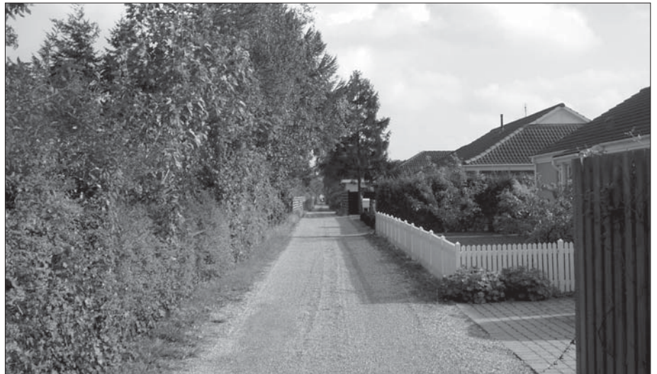
Hække contra plankeværker, store træer i små haver, byggeri i skel og vejvedligeholdelse. Der er nok at tage fat på for et vejlaug.