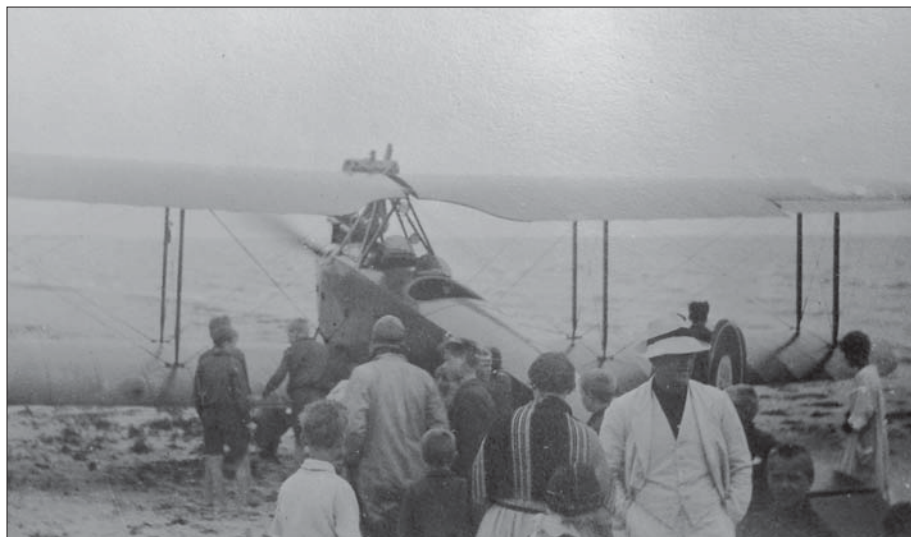
Solrød Strand var bestemt ikke overbefolket i 1923, men et fly på stranden kunne alligevel samle opløb.

Det må forbavse, at et fly ligefrem er landet på stranden. Men det er ikke desto mindre rigtigt. I 1923 fotograferede grosserer Møller et landet fly omringet af mange interesserede tilskuere. Hr. Møllers sommerhus på Svend Gøngesvej