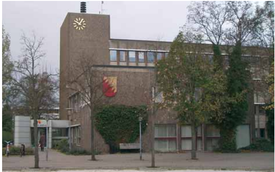
Borgermøderne foregår som regel på Solrød Rådhus

Der har de seneste år været et meget højt aktivitetsniveau. Det skyldes bl.a. ønsker fra borgere/virksomheder/grundejerforeninger om revidering af eksisterende og måske utidssvarende lokalplaner, hvor der også efterspørges mere præcise regler for hvad borgerne/virksomhederne kan forvente.