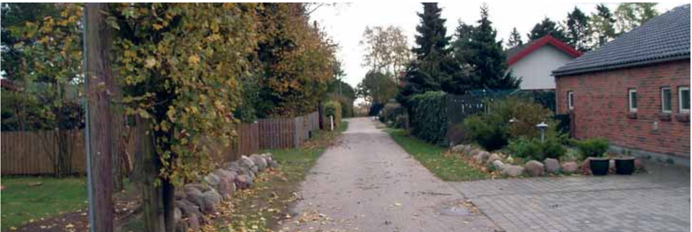
Er der behov for vendeplads her?

Efter foreningens mening er de principielle udpegninger ikke et arealudlæg, og er på ingen måde tilstrækkelig til at konkretisere udpegningens konsekvenser. Ikke desto mindre kan det til kommunens orientering oplyses, at alene markeringerne af eventuelle kommende vendepladser forringer de pågældende ejendommers værdi med ca. 500.000 kr. Hvem skal betale denne værdiforringelse? Hvorledes beregnes